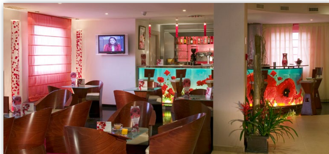
AVDA SAN MARTIN DE VALDEIGLESIAS 4 28922 - ALCORCON

El ibis hotel en Alcorcón Tres Aguas está a 15 minutos del Centro de Madrid en transporte público. Igualmente, se encuentra a 7 km del Recinto Ferial de la Casa de Campo , el Zoo y el Parque de Atracciones.